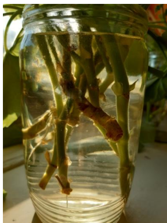
po týdnu už pustily kořínky