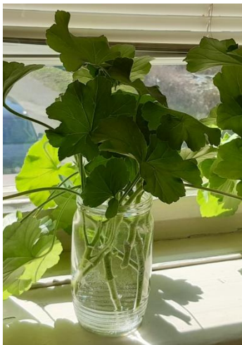
Řízky po uříznutí ve vodě

Takhle vypadaly a vypadají řízky našich muškátů ve třídě