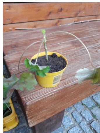
řízek zasazený v zemině