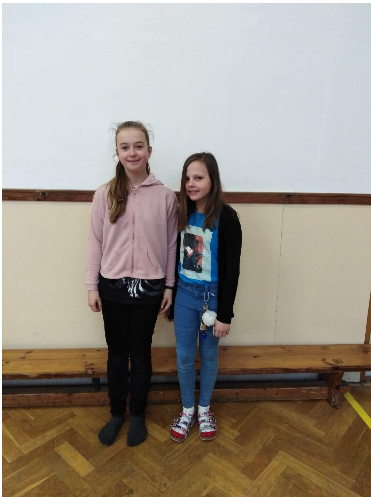
Autor: Emma Gajdošová