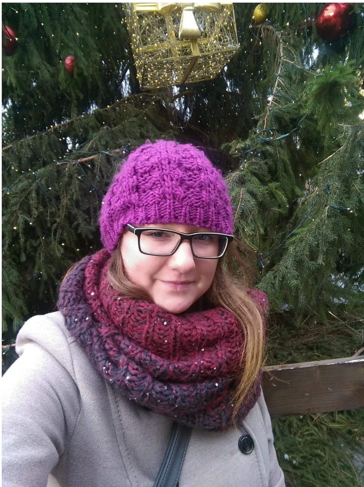
Autorka: Ester Vele