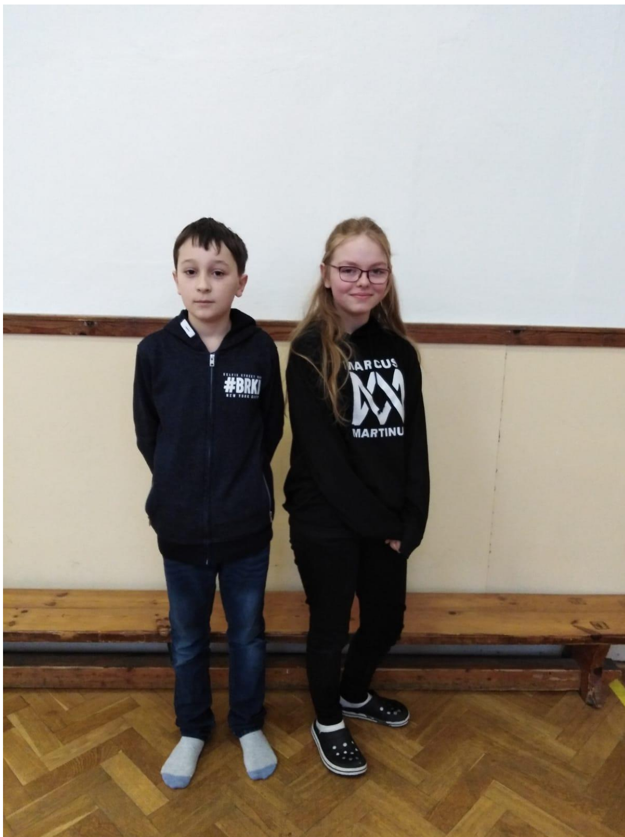
Autor: Ondra Ženíšek