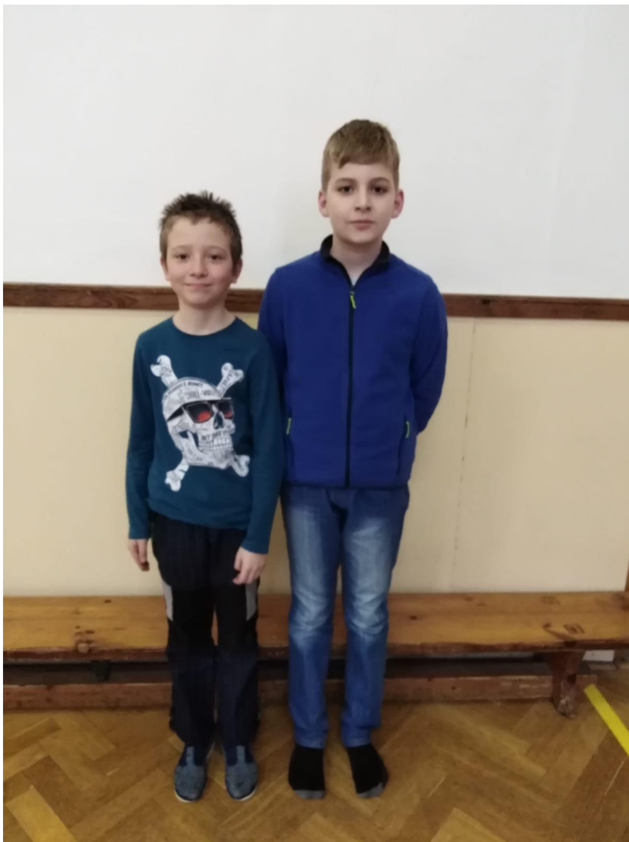
Autor: Filip Kazda, foto: Bára Ženíšková