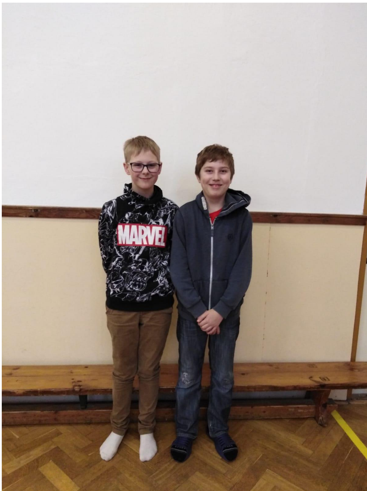
Autor: Ondra Papaj