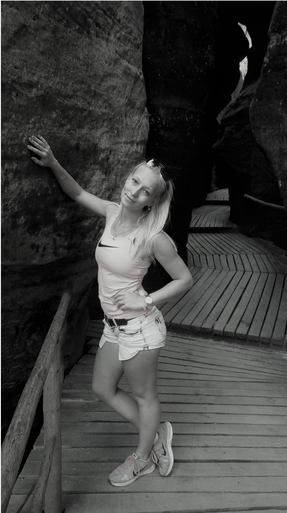
Autorka: Ester Vele