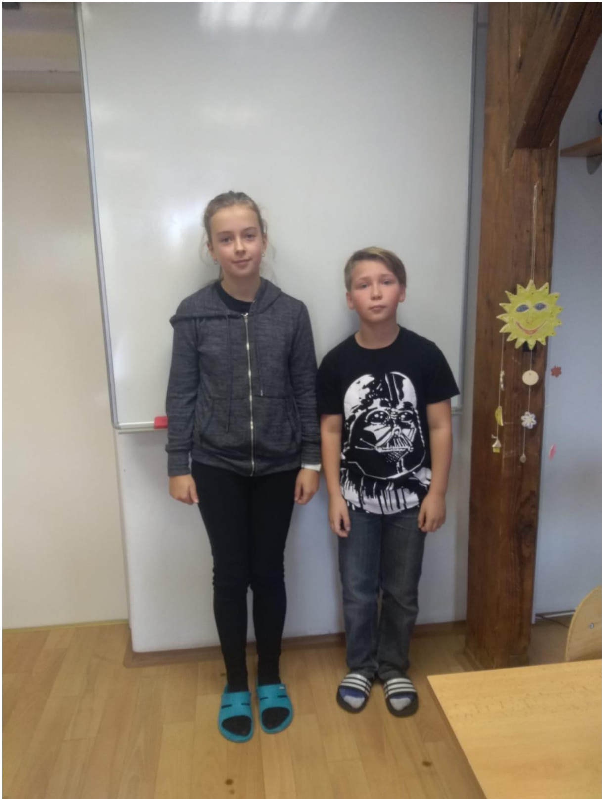
Autorka: Emma Gajdošová