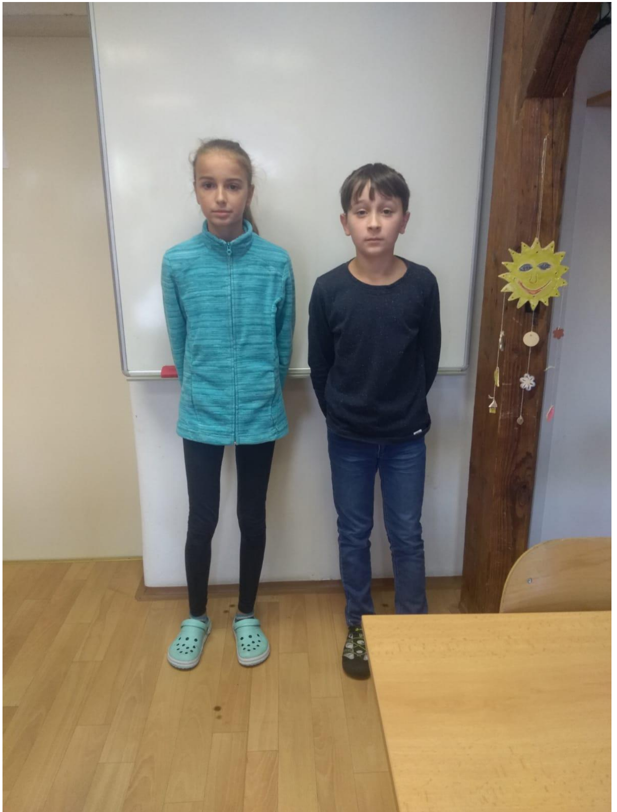
Autor: Ondra Ženíšek