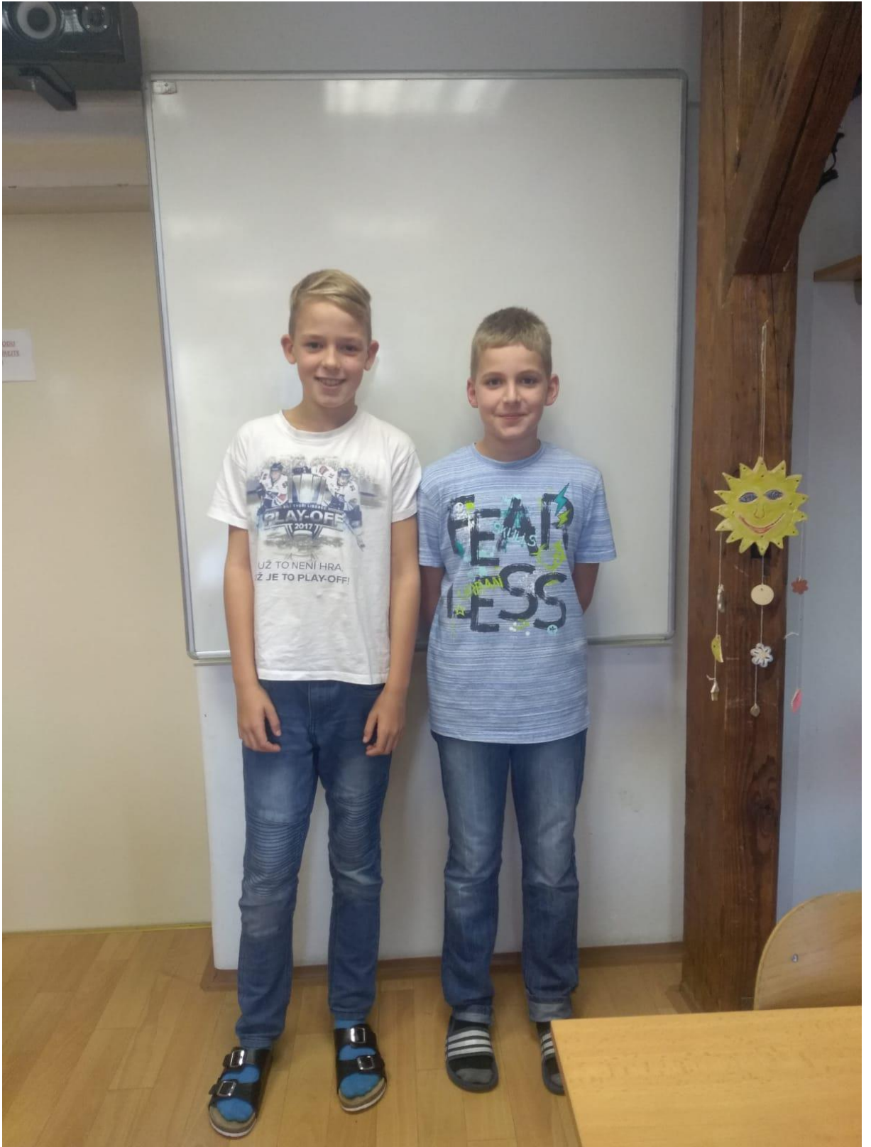
Autor: Filip Kazda