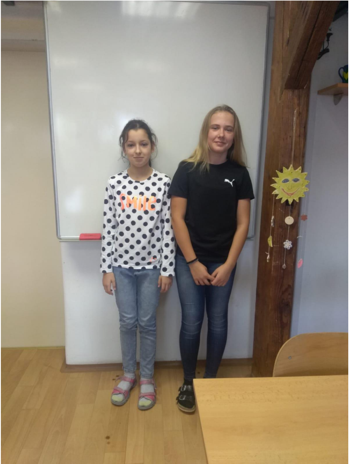
Autorka: Bára Ženíšková, foto: Ester Vele